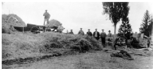
Pressning av halm i Hägg 1922