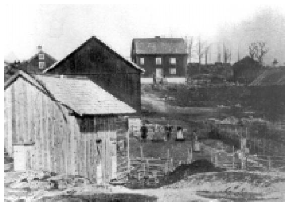
Haglingsgården i Hägg