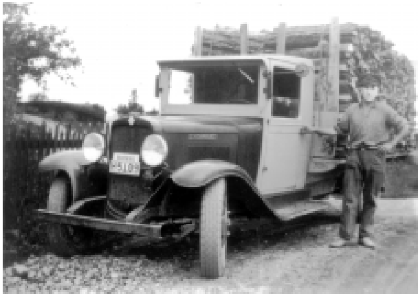
Andra lastbilen blev en Cheverolet